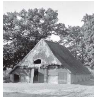
De oude schaapskooi staat nog steeds op het erf van de meest westelijke boerderij in Kraloo.

De boeren bebouwden elk een deel van de gezamenlijke akker – de es – en lieten hun schapen overdag op het Dwingelderveld rondlopen. De herder bracht de beesten 's avonds naar de schaapskooi die nog steeds op het erf van de meest westelijke boerderij staat, aan het pad naar het Dwingelderveld. De weinige koeien graasden langs de beek. 's Winters stond het vee op stal die vol lag met heideplaggen om de uitwerpselen van de dieren op te nemen. In het voorjaar werd dit mengsel als mest over de es uitgestrooid. Die werd ieder jaar een stukje hoger en bollier. Rechts langs het Commissaris Cramerpad is het bolle profiel van de es nog goed herkenbaar.