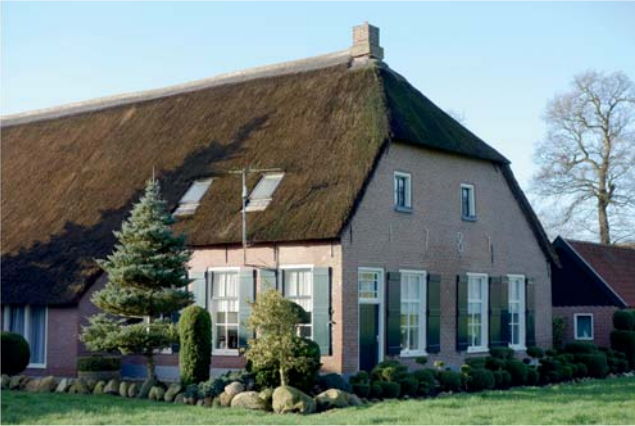
Deze boerderij aan de Molenhoek bestaat al sinds 1787

Het waren rondtrekkende jagers en verzamelaars die het vaartuig lieten liggen en nooit meer terugkwamen. De boot was vrij ongeschonden totdat een graafmachine er 10.000 jaar later zijn tanden in zette.