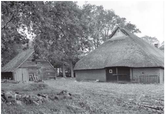
Historisch aanzicht van Pesse