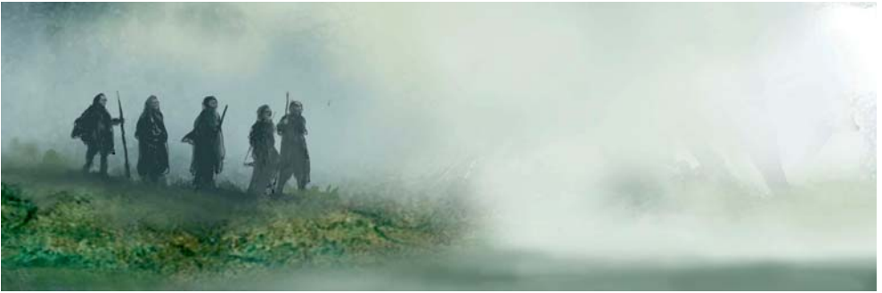
Impressie van het landschap bij Pesse zo'n 11.000 jaar geleden.