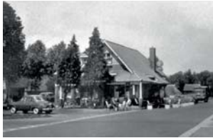
Voormalig café Moes langs de oude hoofdweg

Het dorp lag aan de oude hoofdweg van Hoogeveen naar Assen, met een aftakking naar Ruinen. In de jaren vijftig van de vorige eeuw werd de hoofdweg eerst verbreed en rechtgetrokken en twintig jaar later vervangen door de huidige snelweg A28. Sindsdien zijn